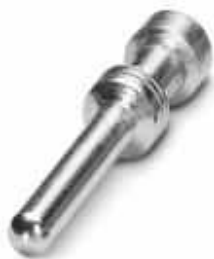
Gedrehter 2,5er Crimpkontakt, Stift-Einzelkontakt, Aderquerschnitt 4,00 mm 2 , versilbert

Bitte beachten Sie, dass die hier angegebenen Daten dem Online-Katalog entnommen sind. Die vollständigen Informationen und Daten entnehmen Sie bitte der Anwenderdokumentation. Es gelten die Allgemeinen Nutzungsbedingungen für Internet-Downloads. ( http://phoenixcontact.de/download )