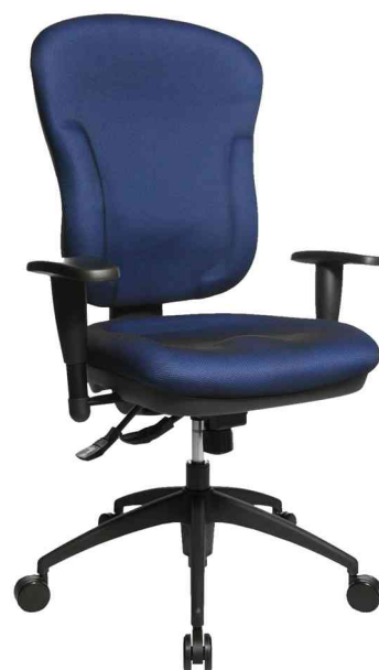
Fauteuil de bureau "Wellpoint 30 SY", bleu avec un accoudoir optionnel type K2(B)