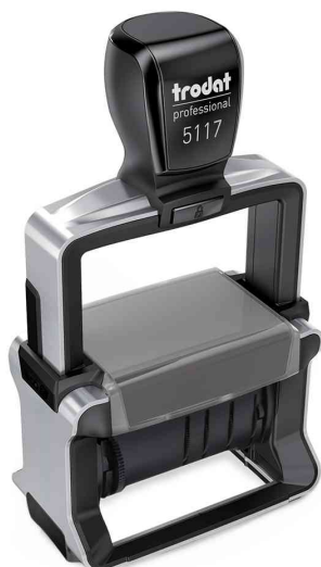
Tampon dateur à bandes Professional 4.0 5117

Accessoires: cassette d'encrage de rechange: en blister, vendu uniquement au conditionnement