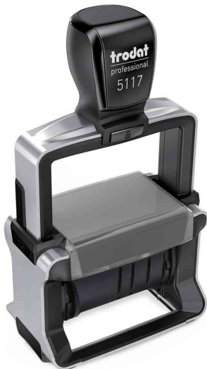
Wortbandstempel Professional 4.0 5117

Zubehör: Ersatzstempelkissen: auf Blisterkarte, Abgabe nur in ganzen VE's