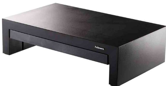
Monitorständer Designer Suites