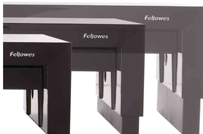
Monitorständer Designer Suites - höhenverstellbar