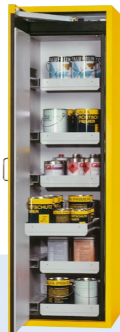
6 Auszüge bieten ausreichend Platz für eine Vielzahl an entzündbaren Gefahrstoffen - Ordnung auf kleinstem Raum, Bestell-Nr. 218-443-J9

Gefahrstoffschränk Edition-G Typ G 601, mit Einlegeböden, Auffangwanne und Lochblechabdeckung (Türfeststellanlage optional)