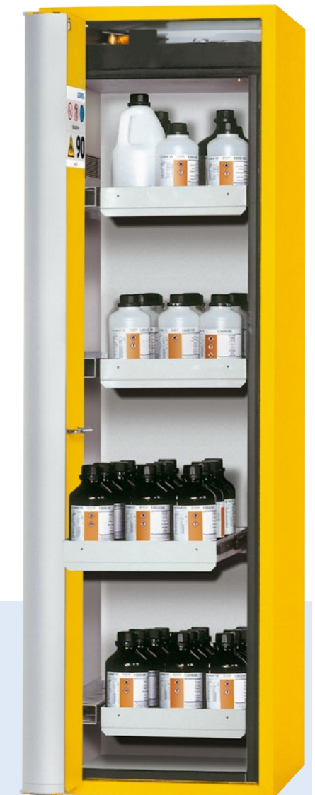
Bei etwas grösseren einzulagernden Gebinden wählen Sie den Gefahrstoffschränk mit 4 Auszugswannen.