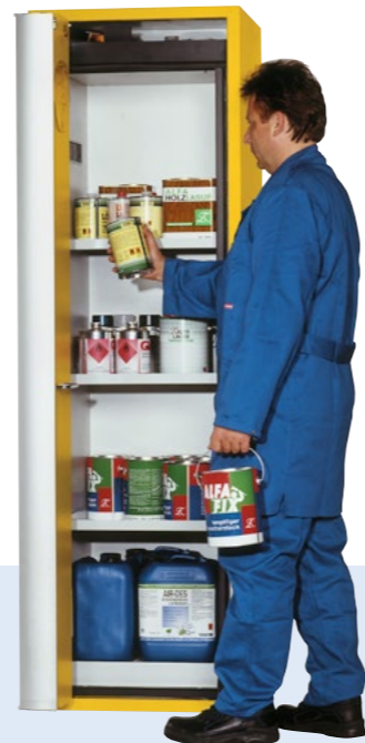
Falлтүрenschrank Edition-G Typ GF-601, mit 3 Einlegeböden und Bodenauffangwanne mit Lochblechabdeckung, Bestell-Nr. 218-456-J9