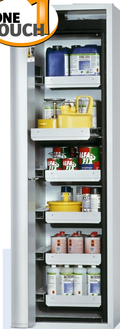
Gefahrstoffschränk Edition-G Typ GF-601.6, mit Falлтүren und 6 Auszugswannen, Bestell-Nr. 119-261-J9