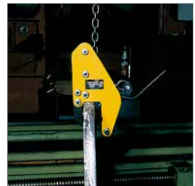
TWG Allzweckgreifer mit geringen Baumaßen für den Einsatz an schwer zugänglichen Stellen (z. B. Drehbank).