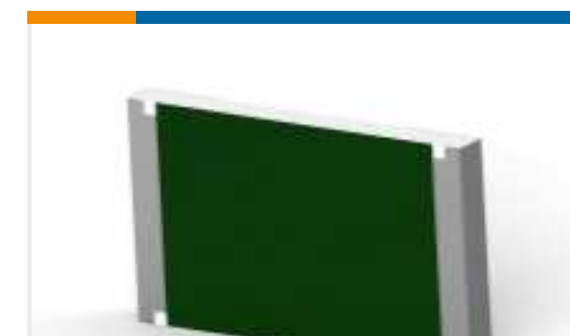
TE Teilnr.:8-2176407-8 3560 27R 5%