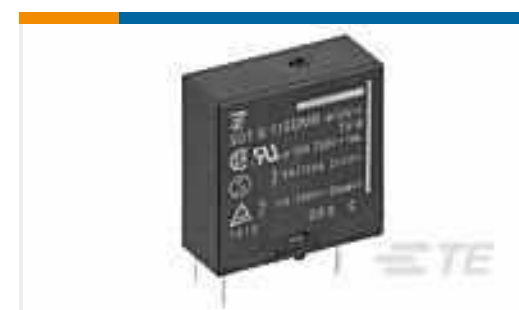
TE Teilnr.:8-1419125-5 SDT-S-106LMR,000