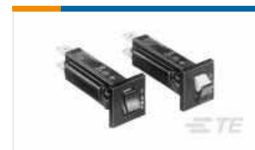
TE Teilnr.:1-1393250-7 W28-XQAT-15=W28