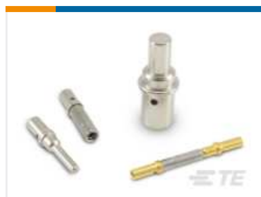
TE Teilnr.:0460-202-16141 MASSIVE DEUTSCH KONTAKTE