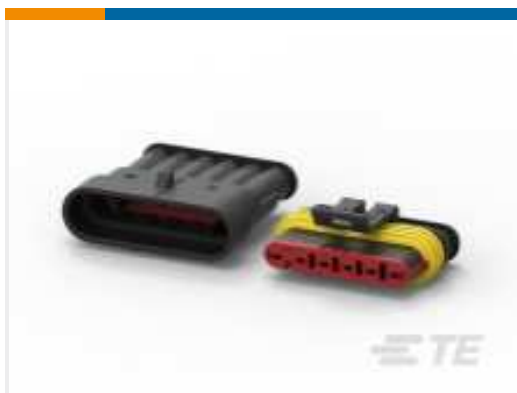
TE Teilnr.:282104-1 AMP SUPERSEAL 1.5MM, STECKVERBINDERGEHÄUSE