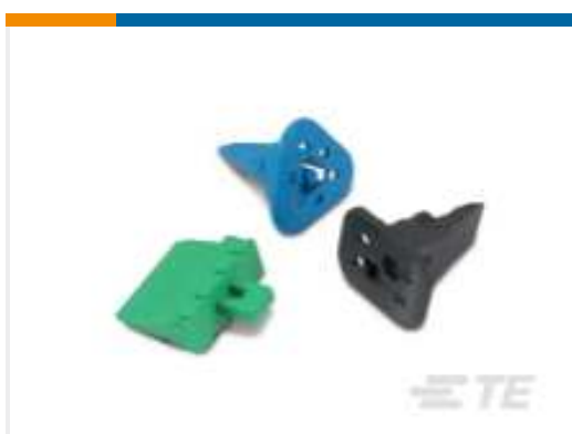
TE Teilnr.:W2S DEUTSCH DT Keilschlösser