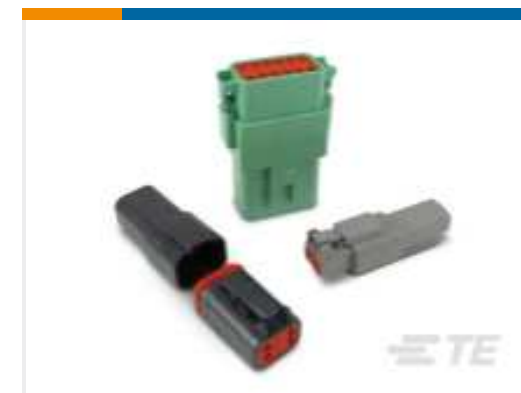
TE Teilnr.:DT04-2P DEUTSCH DT Serie Gehäuse und Steckverbinder