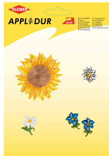
Assortiment d'applications "Flowers 2"