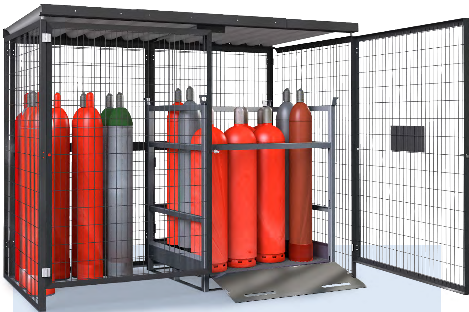
Gasflaschenlager Typ GSN 2.28, ohne Bodengruppe, besonders geeignet zum Einstellen von Gasflaschenpaletten. Durch die Bodenfreiheit der Tür von 160 mm lässt sich das Gasflaschenlager auch bei geöffneten Gasflaschenpaletten wieder verschließen.

i TRGS 510 (Technische Regeln Gefahrstoffe) Als Lager im Freien gelten auch solche, die mindestens nach 2 Seiten offen sind.