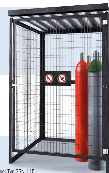
Gasflaschenlager Typ GSN 1.15, ohne Bodengruppe