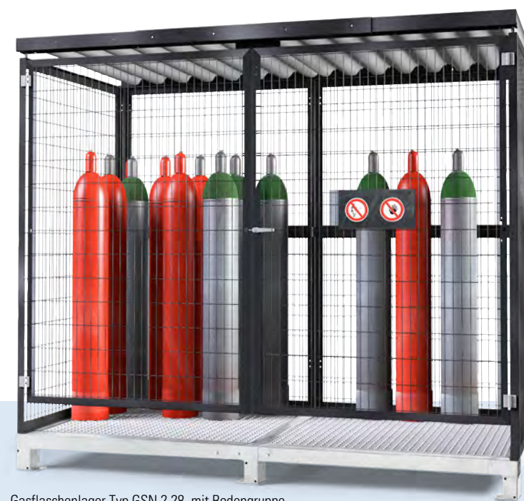
Gasflaschenlager Typ GSN 2.28, mit Bodengruppe

Die Außenwände von Lagerräumen müssen mindestens feuerhemmend sein.