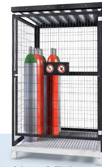
Gasflaschenlager Typ GSN 1.15, mit Bodengruppe