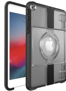
Negro/Clear 77-62208 660543507000