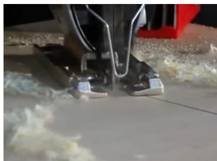
Starkes Gebläse für freie Schnittpur