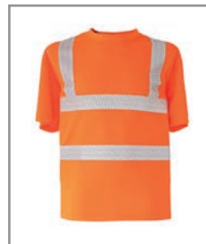
KXVRO Orange S - 7XL