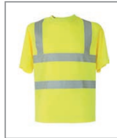
KXVRG Gelb S - 7XL

Industrie, Transport und Logistik, Bau, Behörden, Flughäfen