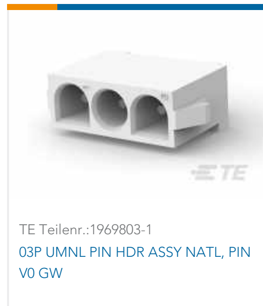
TE Teilnr.:1969803-1 03P UMNL PIN HDR ASSY NATL, PIN V0 GW