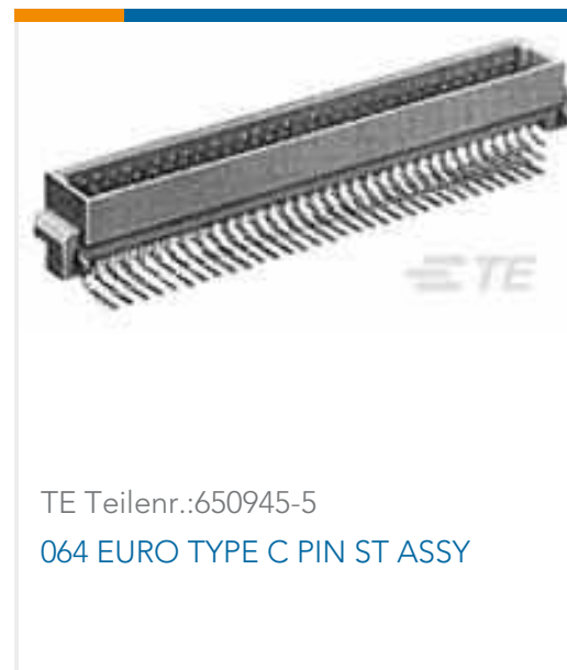
TE Teilnr.:650945-5 064 EURO TYPE C PIN ST ASSY