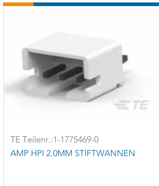
TE Teilnr.:1-1775469-0 AMP HPI 2.0MM STIFTWANNEN