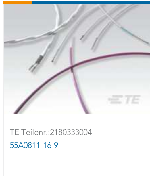
TE Teilnr.:2180333004 55A0811-16-9