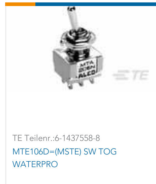
TE Teilnr.:6-1437558-8 MTE106D=(MSTE) SW TOG WATERPRO