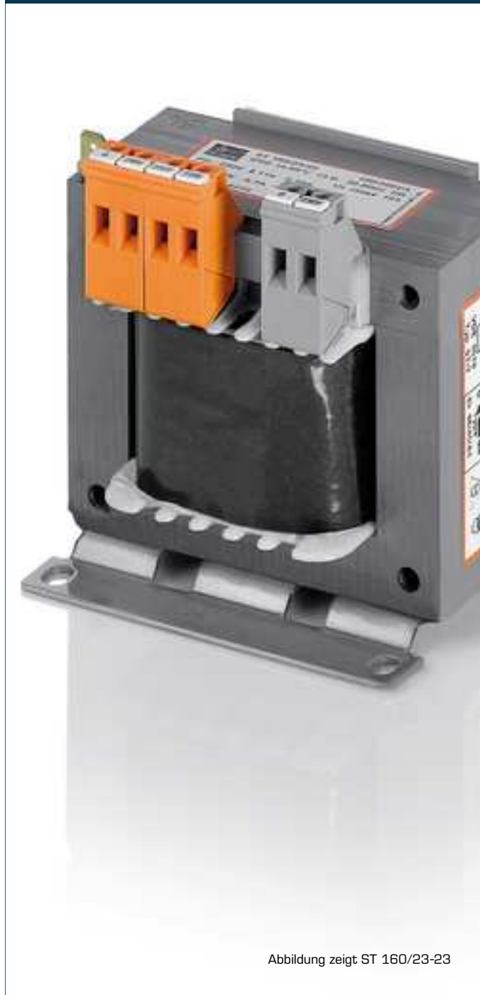
Abbildung zeigt ST 160/23-23