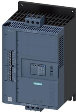
SIRIUS Sanftstarter 200-600 V 13 A, AC/DC 24 V Schraubklemmen Analogausgang