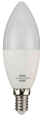
Smarte LED-Lampe SB 400

Anwendungsbeispiele: - für eine smarte Beleuchtung im ganzen Haus