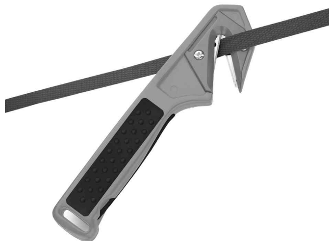
Visuel de référence: montre le produit en utilisation