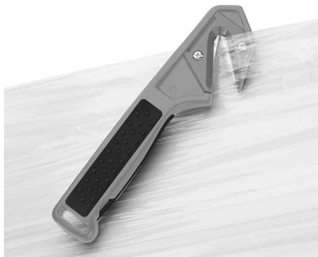
Visuel de référence: montre le produit en utilisation