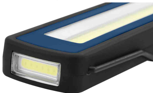
LED supplémentaire sur la tête de lampe