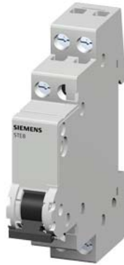
Wechselschalter 20A 1S 1Ö