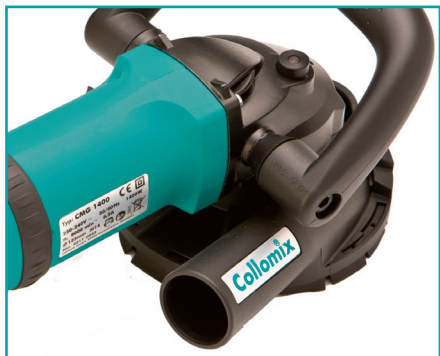
Staubschutzhaube mit Absaugstutzen