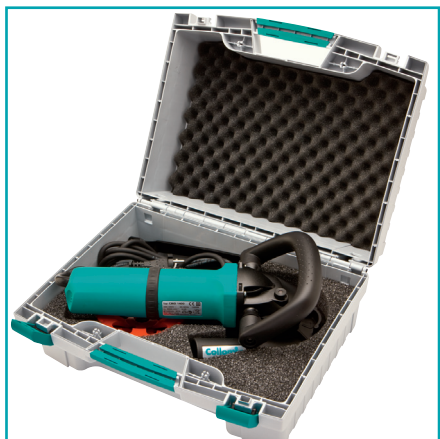
Im praktischen Maschinenkoffer mit Schaumstoffpolsterung

Zum Entfernen von Kleisterrückständen bei Fliesen- oder Bodenbelägen; Abtragen von Beton- und Estrichflächen; Entfernen von Schalungsnähten, Beschichtungen und Anstrichen; Abtragen und Glätten von mineralischen Oberflächen.