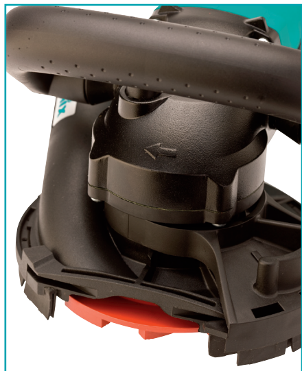
Segmentöffnung für randgenaues Arbeiten