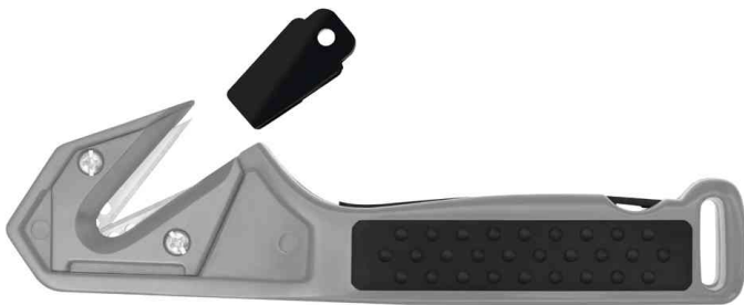
Cutter Professional mit Doppelklinge und Schutzkappe