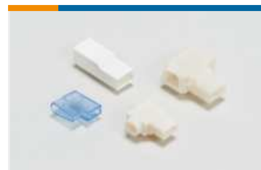
Gehäuse für Crimpkontakte(13)