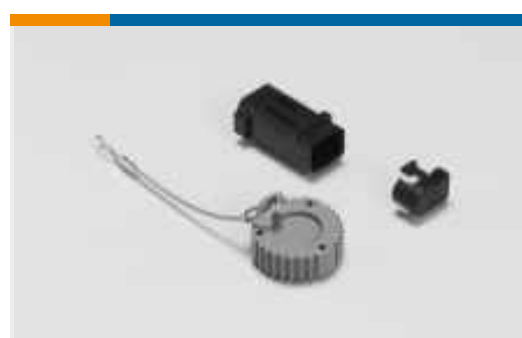
Kappen und Abdeckungen(14)