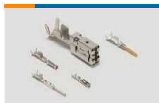
Kontakte für Pkw, Lkw, Busse und Off- Road-Fahrzeuge(149)