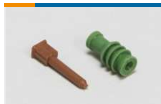
Dichtungen und Blindstopfen(33)