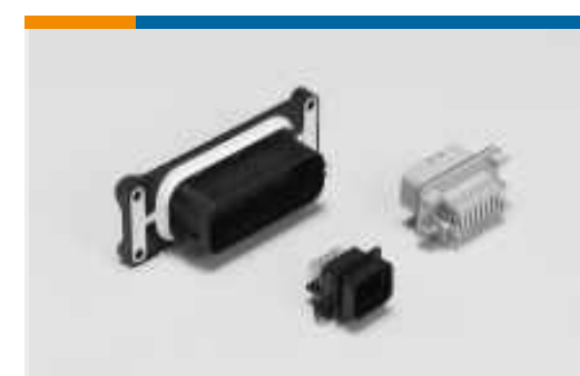
Stiftwannen für Pkw, Lkw, Busse und Off-Road-Fahrzeuge(96)