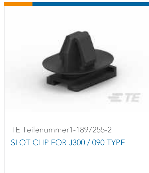
TE Teilenummer1-1897255-2 SLOT CLIP FOR J300 / 090 TYPE