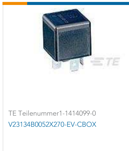
TE Teilenummer1-1414099-0 V23134B0052X270-EV-CBOX