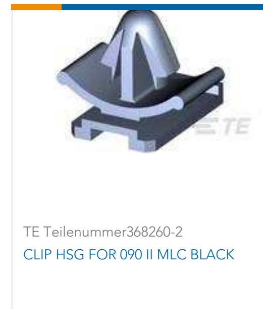
TE Teilenummer368260-2 CLIP HSG FOR 090 II MLC BLACK