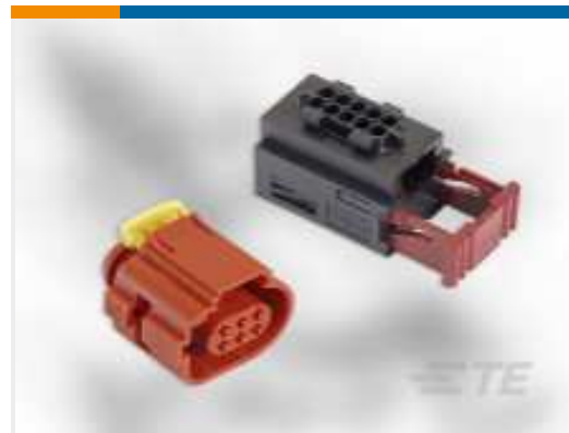
TE Teilenummer CAT-T4827-CH8172 ZEITSCHALTER, STECKVERBINDERGEHÄUSE