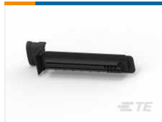
TE Teilenummer 85193-2 J+MICRO TIMER 55P PLUG ASSY(L)