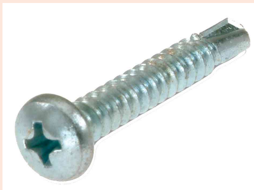
Visuel de référence: vis autoforeuse, tête bombée