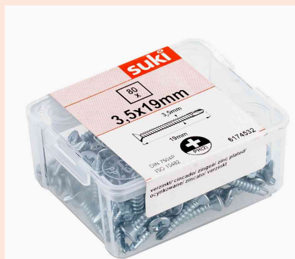
Visuel de référence: vis autoforeuse, dans une boîte en plastique