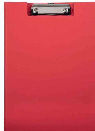
Porte-bloc à pince MAULpoly, rouge