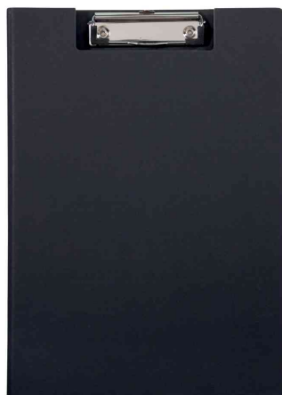
Porte-bloc à pince MAULpoly, noir