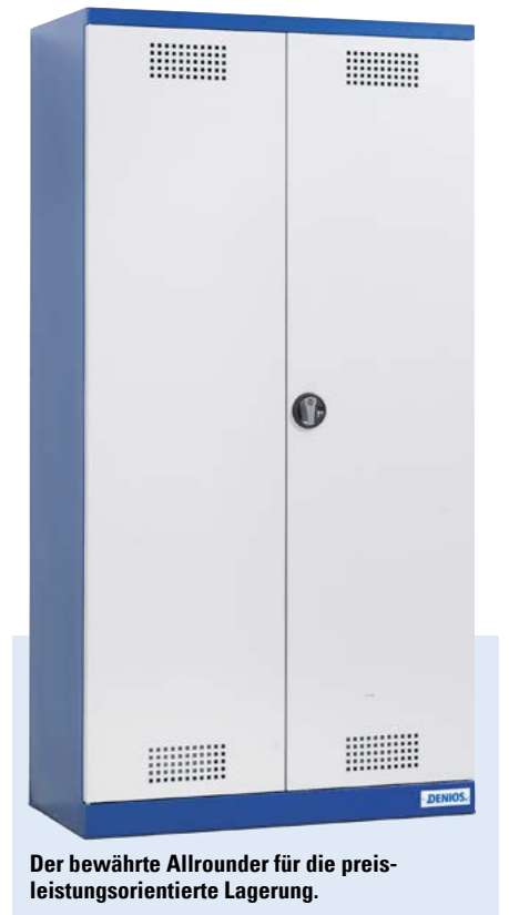
Der bewährte Allrounder für die preisleistungsorientierte Lagerung.

Chemikalienschrank Easy - der Allrounder für Werkstatt und Labor. Die Kombination von Einlegeböden und Bodenwanne bietet sicheren Lagerraum, ganz in der Nähe des Arbeitsplatzes.