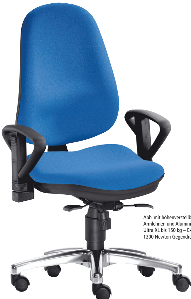
Abb. mit höhenverstellbaren Armlehnen und Aluminium-Fußkreuz. Ultra XL bis 150 kg – Extra Large 1200 Newton Gegendruck.