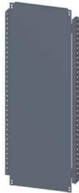
SIVACON, Fachboden, T: 1000 mm, B: 400 mm, verzinkt