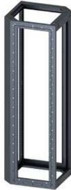
SIVACON, Gerüst, für Eckgehäuse, H: 1800 mm, B: 600 mm, T: 600 mm, verzinkt