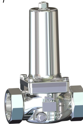
DN 40 - DN 50