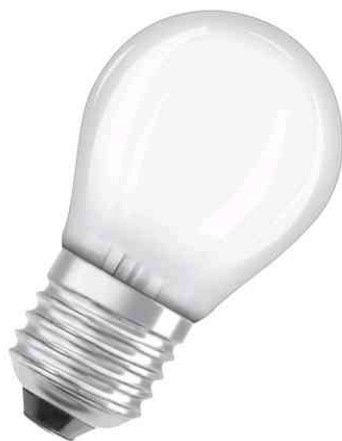
Visuel de référence: Ampoule LED CLASSIC P, culot E27, mat