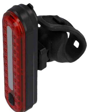
Feu stop de vélo à LED rechargeable

- voir et être vu, pour des déplacements sécurisés dans l'obscurité