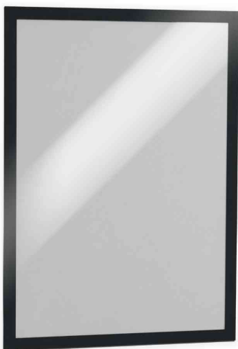
Magnetrahmen DURAFRAME, schwarz