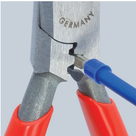
Crimpaggio da 0,5 a 2,5 mm 2