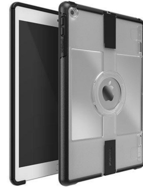
Schwarz/Clear 77-65159 840104212929