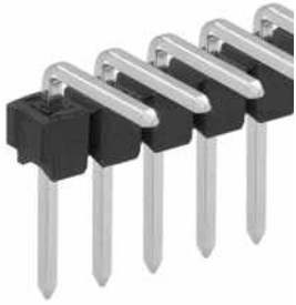
Leiterkartensteckverbinder>Stiftleisten Stiftleiste □ 0,635 mm, "Maße A + B" variabel