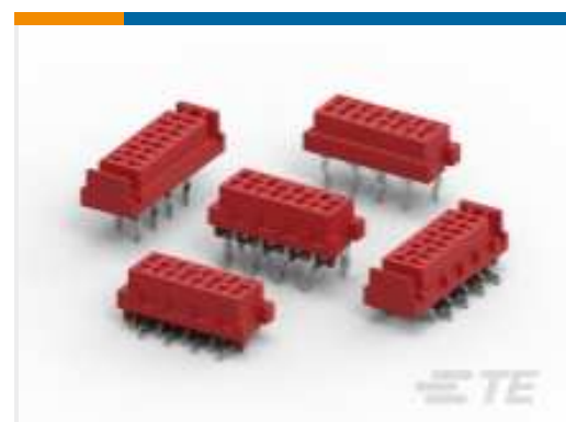
TE Teilnr.:1-338068-4 Buchse-auf-Leiterplatte-Anschluss, von oben steckbar