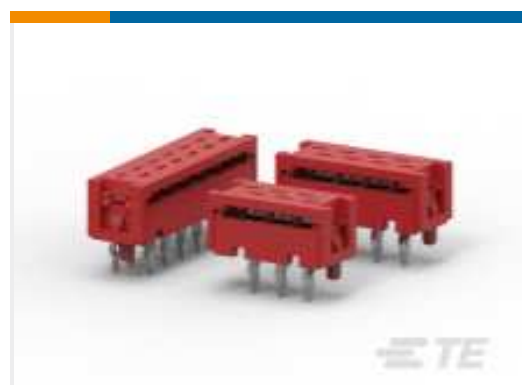
TE Teilnr.:8-215570-0 Paddle Board-Steckverbinder