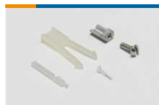
Kodierungen für Leiterplatten- Steckverbinder(1)