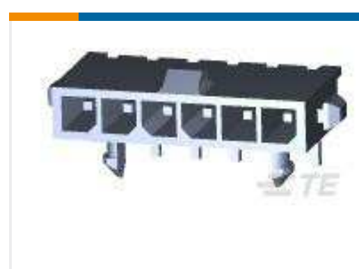
TE Teilnr.:2-1445055-6 MICRO MNL HDR ASSY S/ROW LF