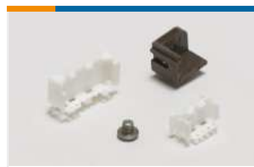
Montage von Leiterplatten- Steckverbindern(8)