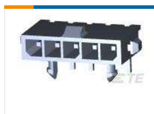
TE Teilnr.:2-1445055-5 MICRO MNL HDR ASSY S/ROW LF