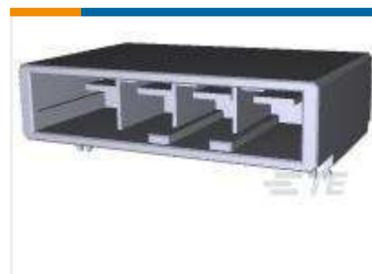
TE Teilnr.:1-917541-2 DYNAMIC D-5 S/ROW HDR ASSY 4P H