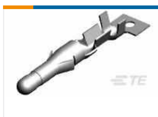
TE Teilnr.:350418-1 .093 COMM P&S PIN 18-24 PTPBR