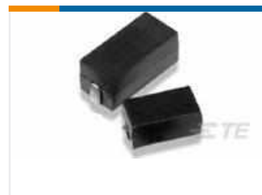
TE Teilnr.:2-1879021-9 SMW3 1R5 5%