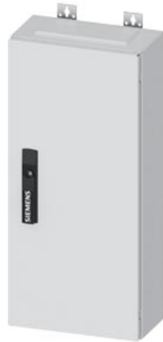
ALPHA 160 DIN Wandverteiler Aufputz mit Verteilerfeld, IP44, Schutzklasse 2 H=650mm, B=300mm, T=140mm RAL 9016