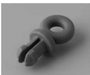
A9100002 Ringöse PA 6 vulkan