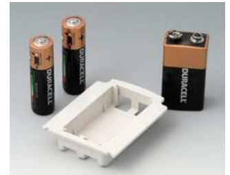
A9176128 Batteriefach XS, 2 x AA oder 1 x 9 V ABS (UL 94 HB)