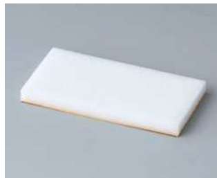
A9250250 Distanzteil PE-Zellschaumstoff 50x25x4mm