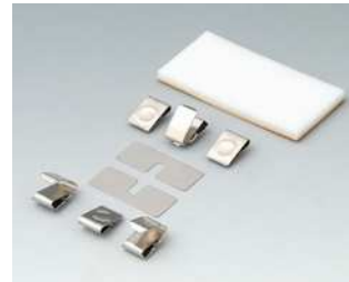
A9176008 Kontaktfedern-Set, 3 x AA Stahl vernickelt