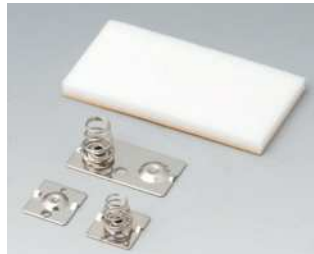
A9176007 Kontaktfedern-Set, 2 x AA Stahl vernickelt