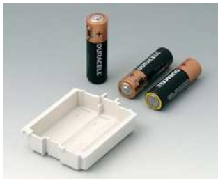
A9176158 Batteriefach XS, 3 x AA ABS (UL 94 HB) grauweiß RAL 9002