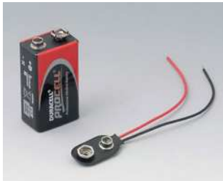
A9160003 Druckknopfanschluss, 1 x 9 V (PP3)