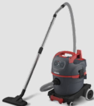
NSG uClean LD-1420 HMT Leichtgewichtiger Reinigungssauger mit 20-l-Behälter und großem Aktionsradius 016269