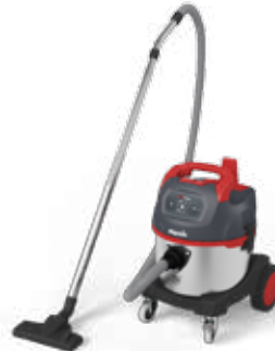
NSG uClean LD-1422 HZ plus Reinigungssauger speziell für die Heizkesselreinigung, mit 22-l-Behälter 016399