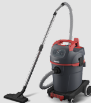
NSG uClean LD-1432 HMT Leichtgewichtiger Reinigungssauger mit 32-l-Behälter und großem Aktionsradius 016276