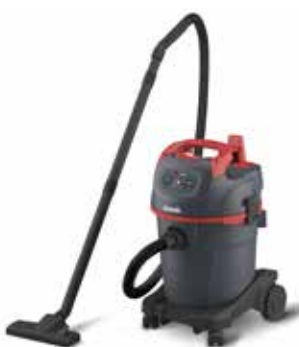
NSG uClean 1432 HK

Leichtgewichtiger Reinigungssauger mit 32-l-Behälter