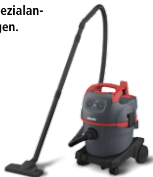
NSG uClean 1420 HK

Die universell einsetzbaren Reinigungssauger der „uClean“ Serie, sind optimal geeignet für das Nass-/Trocken-Profireinigen von Gebäuden, Maschinen, für Grobschmutz in Industrie und Gewerbe oder Spezialanwendungen wie Heizkesselsaugen.