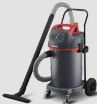
NSG uClean 1445 ST Grobschmutz Reinigungssauger mit 45-l-Behälter 016252

Alle LD-Geräte sind zusätzlich geräuschgedämmt und auf ECO-Modus umschaltbar.