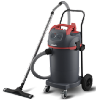
NSG uClean LD-1445 PZ Reinigungssauger für Gebäude-, Großflächen-, und Maschinenreinigung, mit 45-l-Behälter 016283