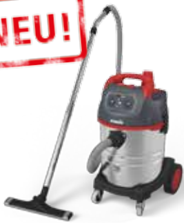
NSG uClean LD-1435 PZ Reinigungssauger für Gebäude-, Großflächen-, und Maschinenreinigung, mit 35-l-Behälter 017389