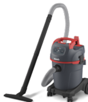
NSG uClean 1432 ST

Grobschmutz Reinigungssauger mit 32-l-Behälter