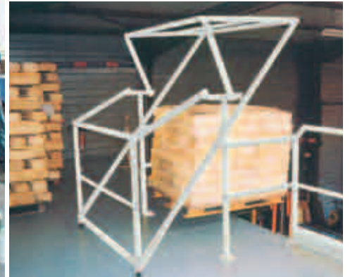
Übergabestation als Sicherheitsschleuse