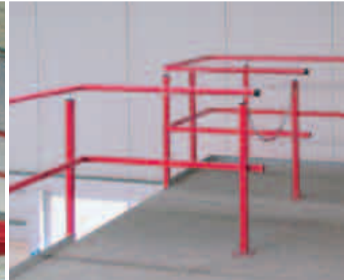
Übergabestation mit Sicherungskette