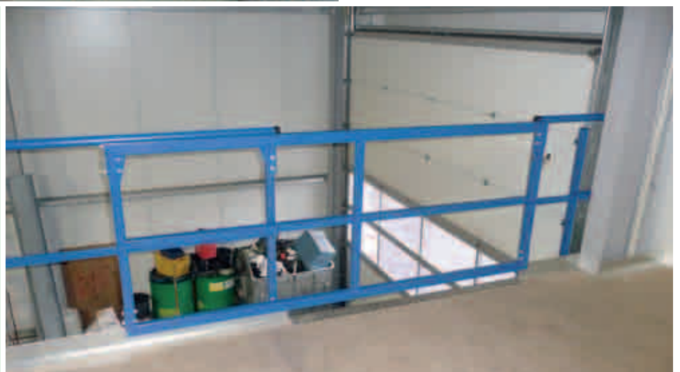
Übergabestation als Schiebetor