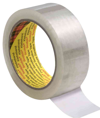
3M Ruban adhésif d'emballage 305, transparent