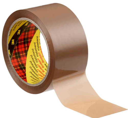
3M Ruban adhésif d'emballage 305, marron