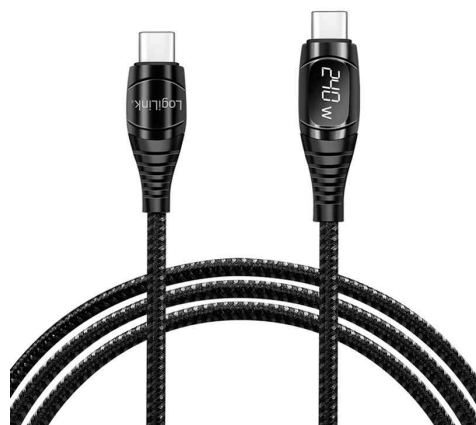
Câble de chargement USB 2.0, connecteur USB-C - connecteur USB-C, affichage OLED

- Les appareils mobiles d'une puissance maximale de 100 watts (5 A) peuvent être rechargés via un chargeur mural USB-C, un chargeur allume-cigare ou une banque d'alimentation