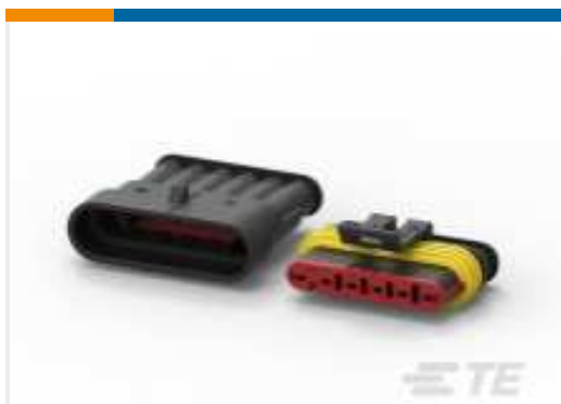
TE Teilnr.:282104-1 AMP SUPERSEAL 1.5MM, STECKVERBINDERGEHÄUSE