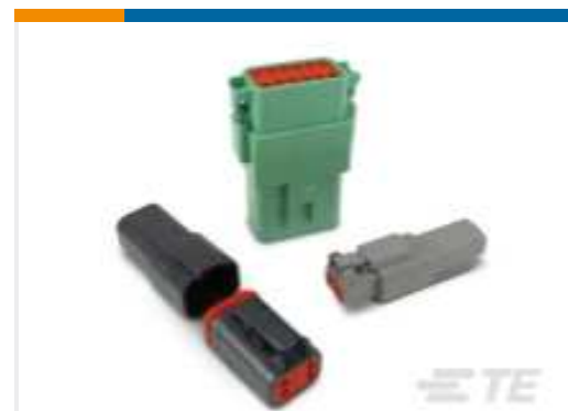
TE Teilnr.:DT04-2P DEUTSCH DT Serie Gehäuse und Steckverbinder