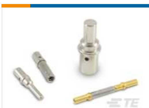
TE Teilnr.:0460-202-16141 MASSIVE DEUTSCH KONTAKTE