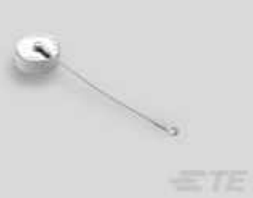
TE Teilnr.:YDTS33Z11NV0010000 CAP ASSEMBLY