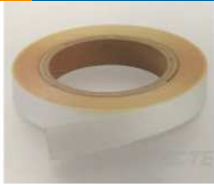
TE Teilnr.: 890060-000 S1017-1.0X50