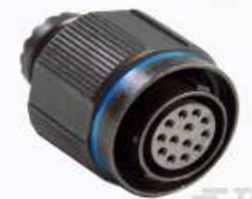
TE Teilnr.:YDTS26Z17-26PNV001 PLUG ASSY