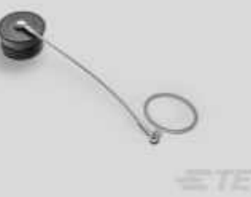
TE Teilnr.:YDTS32Z17NV0010000 CAP ASSEMBLY