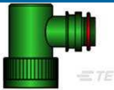
TE Teilnr.:749301-000 TXR40AB90-1208AI