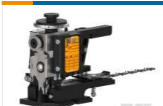
TE Teilenummer2150488-1 OCEAN_2.0_Applicator-E-110F152F