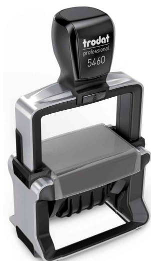
Tampon dateur Professional 4.0 5460

Zubehör: Ersatzstempelkissen: Abgabe nur in ganzen VE's