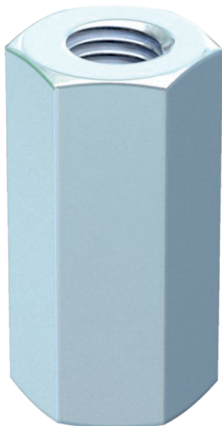
Verbindingsmoer met volledige binnendraad.