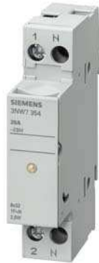
SENTRON, Zylindersicherungshalter, 10x38 mm, 1P+N, In: 32 A, Un AC: 690 V, LED Signalmelder